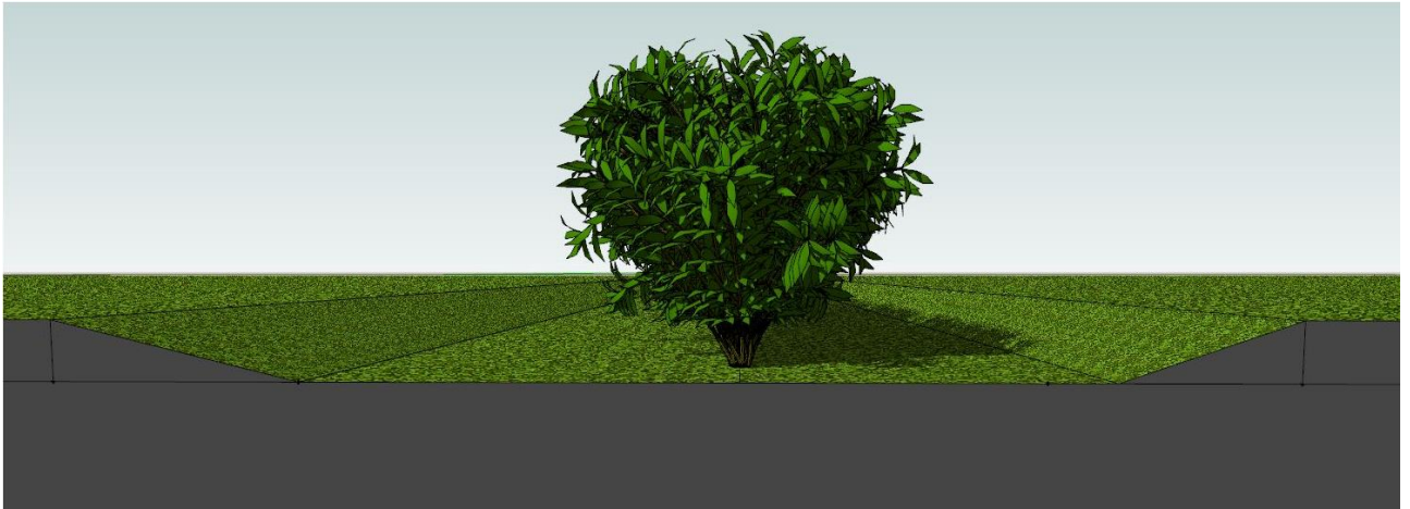
Kuva 2. Esimerkki hulevesien viivyttämisestä tontin rajalla. Yhteisestä hulevesien viivyttämisestä tulee sopia kirjallisesti naapurin kanssa.