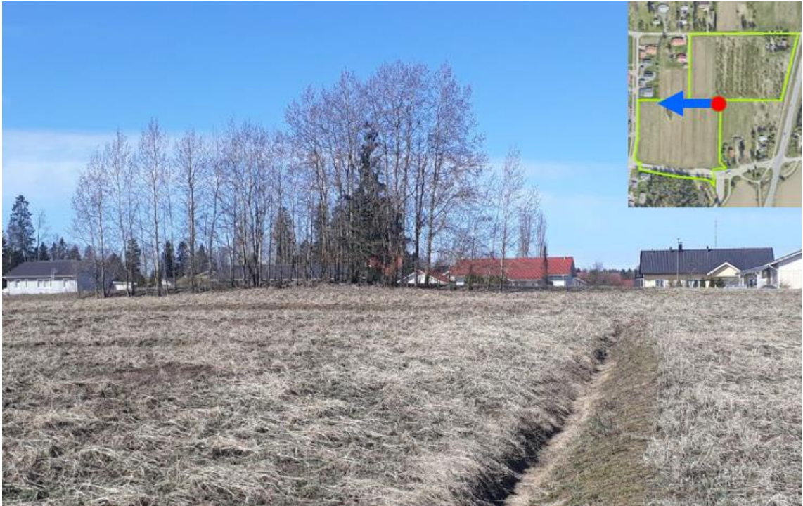
Kuva 1. Oikeassa yläkulmassa punaisella pisteellä merkitty kohta, josta isompi kuva on otettu; sinisellä nuolella on merkitty kuvan suunta.

Käytettävien rakennusmateriaalien tulee olla ekologisesti kestäviä sekä tervettä ja rakentamista edistäviä. Rakentamisen ylijäämämassat voidaan hyödyntää tontilla. Niillä voidaan toteuttaa monimuotoista pihaa. Vältetään ylimääräisten maamassojen tuomista tonteille. Mukauteen rakentamista mahdollisuuksien mukaan maan korkotasoon ja muihin luontaisiin olosuhteisiin. Rakentamisen aikaiset hulevedet tulee viivyttaa tontilla. Huleveden viivyttämisen takia pihoissa tulee välttää vettä läpäisemättömiä pintoja, kuten laatoitus- ja kivipintoja.