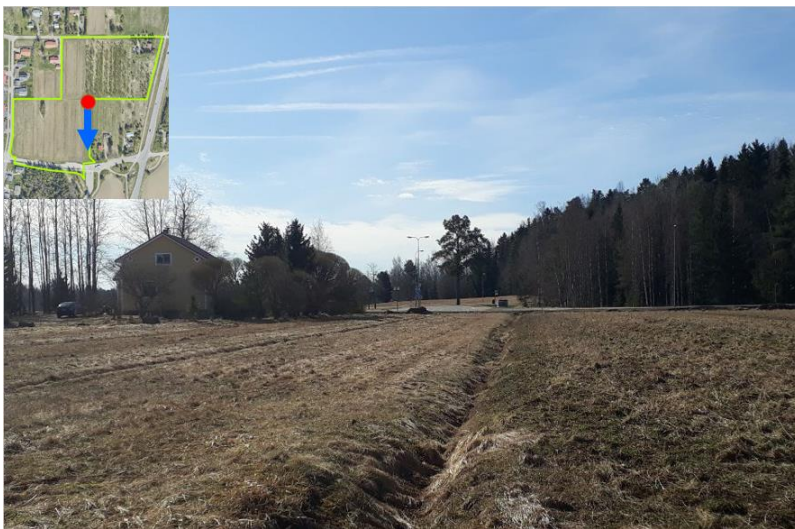
Kuva 4. Vasemmassa yläkulmassa pikkukuvassa punaisella pisteellä merkitty kohta, josta isompi kuva on otettu; sinisellä nuolella kuvan suunta.

Aidat tulee pystyttää selvästi tontin puolelle, vähintään 50 cm päähän tontin rajasta, ellei yhteisestä aitauksesta ole sovittu kirjallisesti naapureiden kesken. Aidan tyyppi tulee esittää rakennusluvan yhteydessä. Omakotitontit rajataan katua vasten pensasaidalla. Tonttien välisillä rajoilla voidaan käyttää rajauksena korkeintaan 1,2 metriä korkeaa puurakenteista aita tai enintään 2,5 m korkeaa pensasaitaa. Pensasaitalajina tulee suosia ympäristöön ja paikallisiin olosuhteisiin sopivia kotimaisia lajikkeita. Kadun ja tontin välinen pensasaita tulee istuttaa tontin puolelle, jotta pensasaita ei vaurioidu lumen kasaamisesta piennaralueelle.